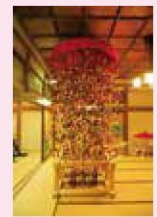
⑨ さるぼぼ 2,000体 さるの赤ちゃんに由来し 魔除けや子宝、 安産を意味するそうです。

⑥ 日本最大級 32段 1,200体のおひなさま 国登録有形文化財 「瑞龍閣」の2階に32段 1,200体の おひなさまが並びます。 日本最大級のひな段は圧巻です。