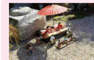
⑬ 玲和の庭 室内展示