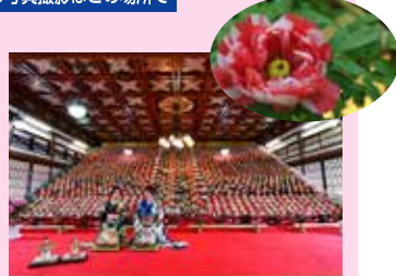
⑥ 日本最大級 32段1,200体のおひなさま 国登録有形文化財 「瑞龍閣」の2階に32段1,200体の おひなさまが並びます。 日本最大級のひな段は圧巻です。