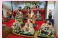
② 人形師3代目好光作「等身大のひな人形」 元日~1/31日まで展示予定