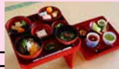
精進料理ひなまつり期間限定 特別ひな御膳(要予約) 3,000円/2名様~ 旬の食材をとり入れた 「美味しい」「身体にやさしい」料理 1/23~3/14