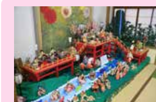
⑬ 玲和の庭 室内展示