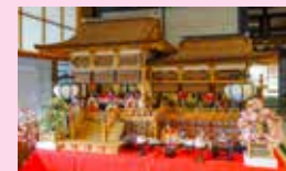
⑦ 江戸時代作京都製の 「檜皮葺白木御殿雛」展示 元日~2/21日